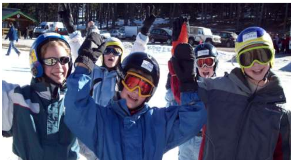
Classe de neige 2008