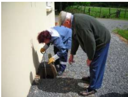
Inspection des regards

Le contrôle fait l'objet d'une redevance d'un montant déterminé Ultérieurement .