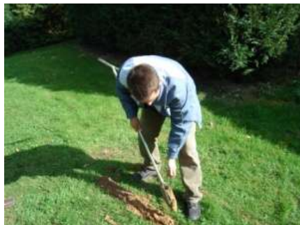
Sondage à la tarière